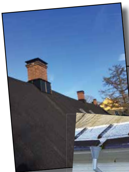
Bilderna visar de nya skorstenkrönen, ståldrännan och ribbläggningen på taket.