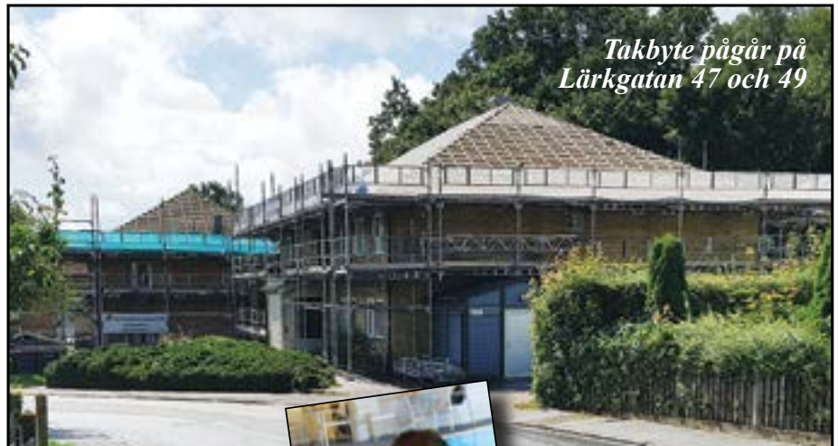
Takbyte pågår på Lärkgatan 47 och 49

Som vanligt har det varit full aktivitet på skolor och förskolor i sommar med renoveringar och ombyggnader, men även i andra fastigheter i HFABs bestånd har det genomförts förbättringar.